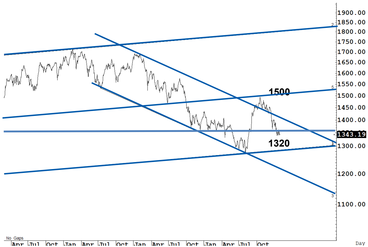
Figure 1 : SET Index daily chart